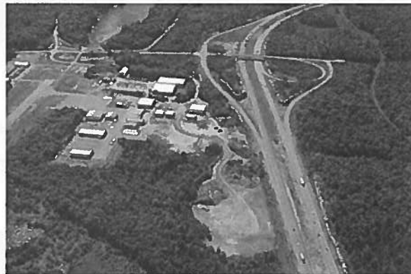
Learn how Parry Sound Airport's industrial expansion project helped attract 10 new business operators and create 60 full-time jobs.

FedNor can provide funding and expertise to help you develop and implement Community Economic Development projects that will grow your local economy.